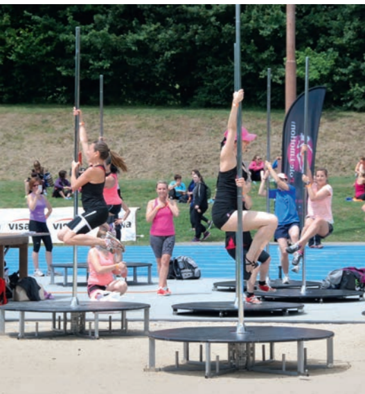
Women Sport Evasion à Lausanne