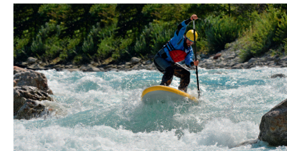
Stand up paddle per avanzati.

5. Cautela durante il trasporto: le tavole sono delicate. Se cadono, possono incrinarsi o scheggiarsi. Per trasportare la vostra tavola sull'auto usate un sistema di fissaggio adeguato. Se usate un set di cinghie, non tiratele troppo per evitare di danneggiare le tavole.